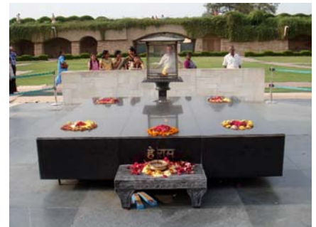
Mahatma Gandhi Memorial

Großstädte arrogant und kalt wirken sollen, zutreffend ist. Doch auch hier spielten Zeit und Geduld eine Rolle. Nach den ersten drei Wochen voller Unsicherheiten, Missverständnissen und Problemen war ich bereit, die Stadt wie sie ist anzunehmen und „verliebte“ mich in sie. Zu dieser positiven Entwicklung hat mein Praktikum am UNIC entscheidend mitgetragen.