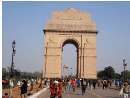
India Gate in New Delhi

in Janakpuri verhalf mir zu Fähigkeiten, wie das Handeln auf dem Markt, sich in Bussen durchzusetzen ohne ein Wort Hindi zu verstehen oder auch im Laufe der Zeit, ein Gefühl für die Sprache zu bekommen, die für meinen Aufenthalt notwendig waren.