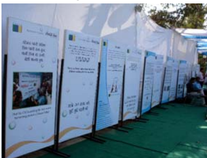
World Water Festival (Jal Tarang))

Dieses Fest wurde neben dem UNIC auch interessanterweise von Coca Cola unterstützt. Neben Diplomaten und Geschäftsmännern, die etwas „social cause“ beitragen wollten, waren viele Künstler, die sich durch Unterhaltungselemente wie Tanz, Gesang und Schauspiel aktiv an dem Fest beteiligten.