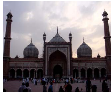
Jama Masjid Moschee

gegensätzlich, modern. Jedoch verglichen zu Mumbai ist diese Stadt konservativer; denn ab 23 Uhr ist es im Zentrum dieser Stadt ruhig.