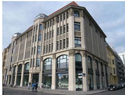
Theologische Fakultät der Humboldt Universität zu Berlin

In den 6 Semestern des B.A.-Studiums werden die Themen Kultur/Identität, Gesellschaft/Transformation und Sprache/Kommunikation behandelt.