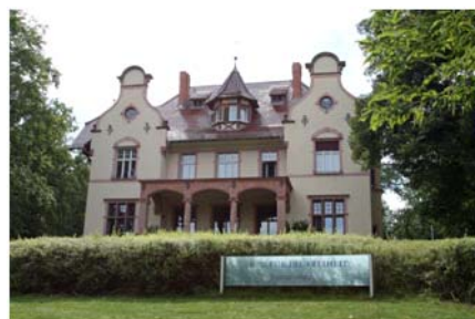
Friedrich-Naumann-Stiftung, Truman-Haus, Potsdam