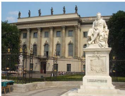
Hauptgebäude der Humboldt Universität zu Berlin

Ein Indienaufenthalt ist aber nicht nur eine Möglichkeit, den heimischen Hörsälen einmal zu entfliehen und über den Tellerrand hinaus zu blicken. Vor allem für Studenten der Indologie und Regionalwissenschaften ist eine Studienreise geradezu eine Notwendigkeit.