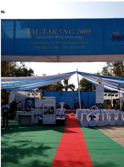
World Water Festival (Jal Tarang)

World Women's Day oder der ESCAP (Economic and Social Council for Asia Pacific) Buchvorstellung. Die reizvollste Aufgabe war, dass ich das UNIC bei dem World Water Week Festival (Jal Tarang) repräsentieren sollte.