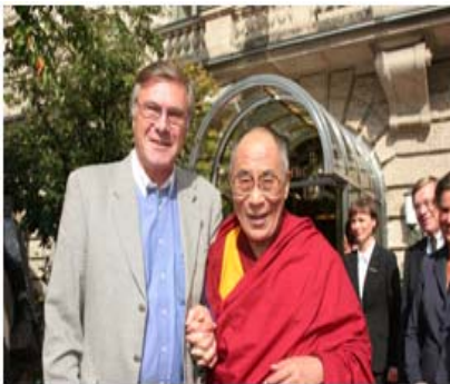
Vorstandsvorsitzender der Friedrich-Naumann-Stiftung Dr. Wolfgang Gerhardt im Gespräch mit S.H. Dalai Lama

Die Friedrich-Naumann-Stiftung für die Freiheit ist die liberale deutsche politische Stiftung. In unserer Arbeit in Deutschland und in mehr als 60 Ländern weltweit setzen wir uns für die Verwirklichung von mehr Freiheitlichkeit in Politik, Wirtschaft und Gesellschaft ein. In Indien führen wir seit 41 Jahren Projekte durch, vornehmlich in den Bereichen Bürgerrechte, Rechtsstaat, wirtschaftliche Freiheit und Konfliktprävention.