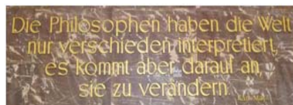
Zitat von Karl Marx im Foyer der Humboldt Universität zu Berlin

Stationen für Praktika in Indien sind zahlreich. Dabei obliegt es aber auch dem eigenen Ideenreichtum (oder den Tipps von Bekannten oder Professoren), wo und mit wem man sich dann während seines Auslandsaufenthaltes beschäftigt. Von Wirtschaftsunternehmen über NGOs und Volunteer-Büros gibt es ein breites Spektrum der Möglichkeiten. Eine interessante Alternative ist allerdings auch, ein Semester an einer indischen Universität zu absolvieren.