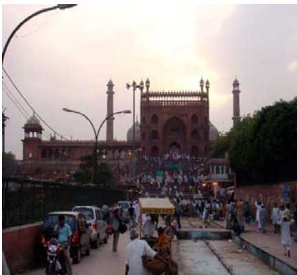
Red Fort in New Delhi

New Delhi zeigte mir ein komplett neues Indien. Ein Indien, das ich nur aus Büchern und TV Beiträgen kannte. Die Diskrepanz und Gegensätze fallen zu Beginn sofort ins Auge und es ist unmöglich, sich ihnen zu entziehen. Da der Mensch sich aber an fast alles gewöhnen kann, ist die Anpassung an diese Umstände auch nur eine Frage der Zeit.