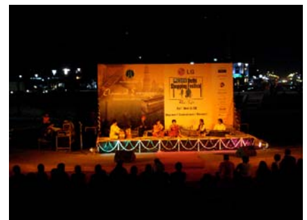
Klassisches öffentliches Konzert

Meine Arbeitskollegen waren zwar leider alle ein paar Jahrzehnte älter als ich, doch hinderte der Altersunterschied nicht, Freundschaften zu schließen und lange Diskussionen zu führen.