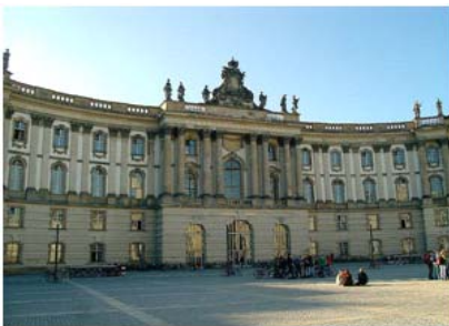
Juristische Fakultät der Humboldt Universität zu Berlin (Bebelplatz)

Der Studienverlaufsplan am Institut für Asien-/Afrikawissenschaften lässt den Studierenden weitgehend freie Hand bei der Semestergestaltung, was einerseits förderlich für die Selbstorganisation ist, andererseits auch die Möglichkeit zu dem wichtigen Auslandssemester eröffnet. So können nach vier Semestern die Module der Regionalwissenschaften bereits abgeschlossen werden und das fünfte Semester bietet Zeit, um den dringend angeratenen Auslandsaufenthalt durchzuführen.