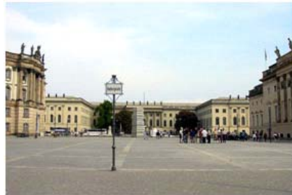
Bebelplatz mit Blick auf die Humboldt Universität zu Berlin

Organisationen, die Praktika beschaffen können.