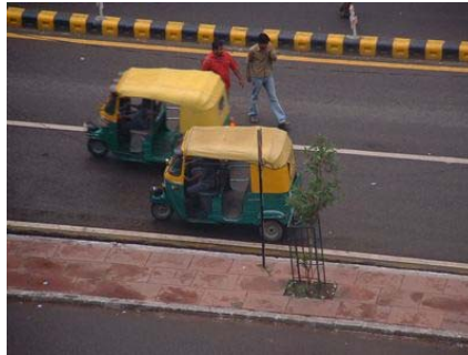
Autorickshaws in Delhi

Delhi hat ein sehr gut ausgebautes Bus-, Metro- und Bahnnetz. Wo diese nicht hinfahren, helfen Autorickshaws