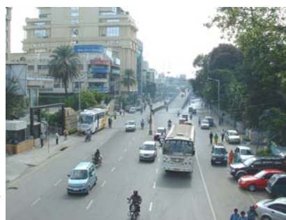
Straßenbild in Bangalore

So punktete TATA - einer der einflussreichsten Konzerne Indiens - mit der Einführung seines lange erwarteten "1-lakh-car". Ein Lakh entsprechen 100.000 Rupien und somit ist TATA's Nano für nur umgerechnet circa 1.700 Euro zuzüglich Mehrwertsteuer und Überführungskosten bald auf indischen Straßen zu sehen. Die internationale Presse überschlägt sich mit Meldungen, das amerikanische Time Magazine wählt den Nano sogar in die Liste der zwölf wichtigsten Autos seit 1908 (siehe unseren Pressespiegel auf S. 6), während die internationale Konkurrenz das Wunder nur staunend betrachten kann.