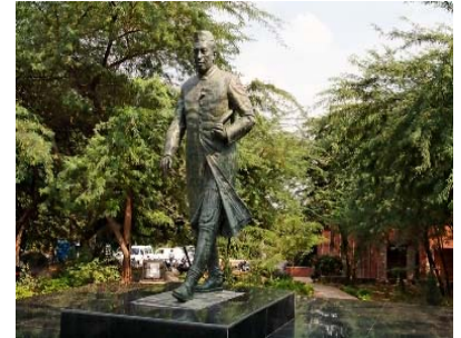
Jawaharlal Nehru Statue

bedenken, dass der Campus der JNU selbst sehr groß ist und ob man sich wirklich eine tägliche Fahrtzeit zur Vorlesung zumuten möchte. Wei-