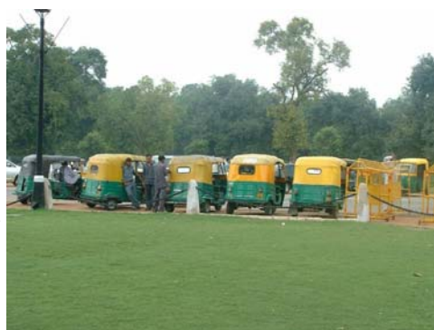
Moderne Rickshaws mit Erdgas in Delhi