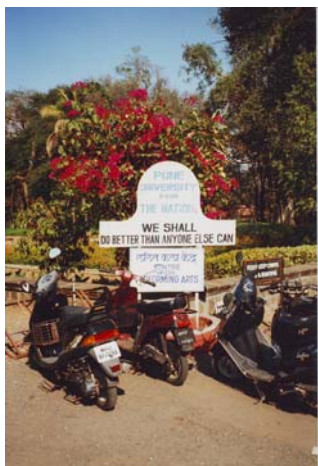
University of Pune

Pune hat sich hinsichtlich dieses Kriteriums wirklich gemauert. Selbst Mumbai's